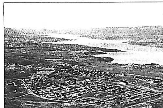
„Sem konungur upp yfir ásana rís...“ Stöð yfir Egilsstaði og Lagarfjöt, til Snaefells.

Varla er vafi á því að hinir fornu Héraðsbúar hafi bundið einhverna átrúnað við Snaefell. Því að fjalla-dýrkun var alltið í heiðnum síð. Við getum rétt ímyndað okkur þá ægilegurd sem birtist hinum fyrstu landnámsmönnum, er þeir komu neðan af fjörðum og litu yfir Héraðið, skógi skrytt og vatnaspeglum, og þessi silfurhvítu tindur blasti við, kórónaður gullnum skjýum í nóntað. Hvað ætli þeim