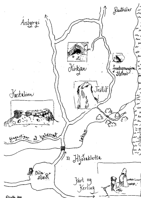
Mynd 2. Hljóðakletthringur

Við mælum með að þið lesið vel yfir leiðarlýsinguna og skoðið þau verkefni sem hægt er að vinna í tengslum við hana.