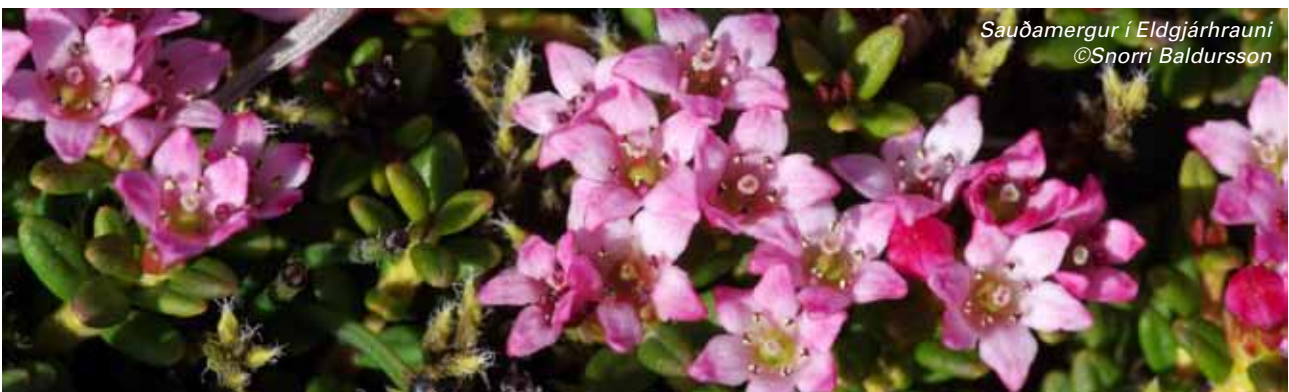
Sauðamergur í Eldgjárhrauni

Í vor og sumar verður unnið áfram að því að merkja leiðir og staði á Tungnaáröræfum. Stíkaður hefur verið áhugaverður hringur fyrir ferðamenn með viðkomu í gígnum Mána, Heljargjá og klettadranginum Dór. Þessi leið er fær óbreyttum jeppum. Fimm hópar sjálfbóðaliða verða að störfum á vestursvæði í sumar við að lagfæra göngustíga, smíða tröppustíga og lagfæra gróðurskemmdir. Sjálfbóðaliðarnir koma einkum frá breskum samtökum, The Conservation Volunteers, sem hafa komið hingað til lands mörg undanfarin ár og áratugi og unnið gríðarlega mikilvægt starf á náttúruverndarsvæðum landsins.