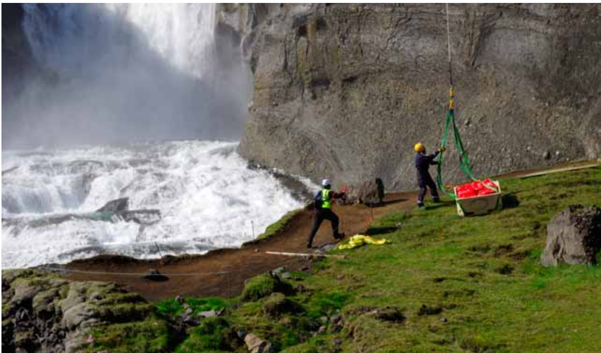
Framkvæmdir í Eldgjá. Líf, þyrla Landhelgisgæslunnar flytur efni í útsýnispall við Ófærufoss.